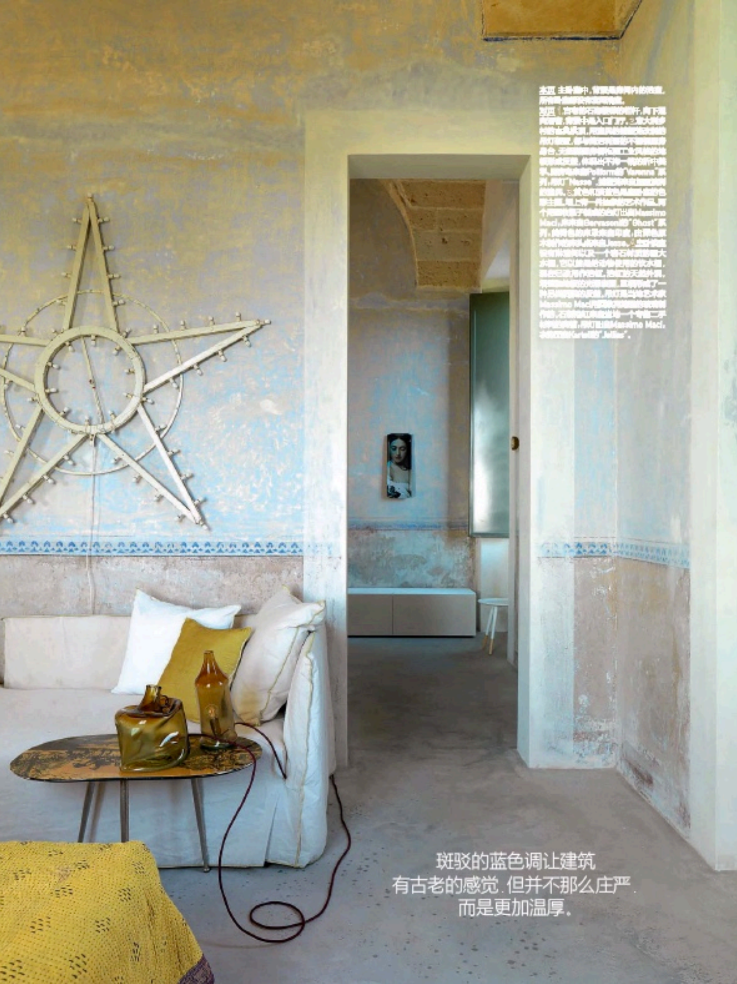
斑驳的蓝色调让建筑 有古老的感觉，但并不那么庄严， 而是更加温厚。

主层 主层中，保留原有室内的构造，用新的材料进行修复。 ① 在修复石墙时，向下掘开原有地面，将雨水引入到了排水系统。 ② 在修复石墙时，向下掘开原有地面，将雨水引入到了排水系统。 ③ 在修复石墙时，向下掘开原有地面，将雨水引入到了排水系统。 ④ 在修复石墙时，向下掘开原有地面，将雨水引入到了排水系统。 ⑤ 在修复石墙时，向下掘开原有地面，将雨水引入到了排水系统。 ⑥ 在修复石墙时，向下掘开原有地面，将雨水引入到了排水系统。 ⑦ 在修复石墙时，向下掘开原有地面，将雨水引入到了排水系统。 ⑧ 在修复石墙时，向下掘开原有地面，将雨水引入到了排水系统。 ⑨ 在修复石墙时，向下掘开原有地面，将雨水引入到了排水系统。 ⑩ 在修复石墙时，向下掘开原有地面，将雨水引入到了排水系统。